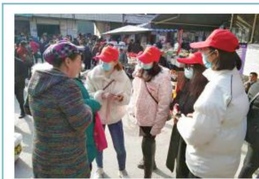
近日，旺苍县开展脱贫攻坚大走访大调研活动，党员干部深入贫困户家中，了解他们的生活情况和困难，送去党和政府的关怀。

本报讯(广东全媒体记者 赵新勇) 剑阁县节水器具普及率100%。通过广泛宣传、示范引领，全县节水器具普及率达到了100%，有效节约了水资源。