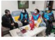
2月7日，七五七五志愿者慰问高坝镇20个贫困村困难群众，发放慰问金及生活物资，为他们的到来送去温暖和关爱。